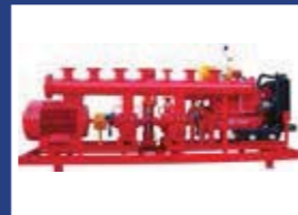
Yangın ve Su Pompaları