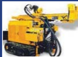
Sondaj ve Forekazık Makineleri