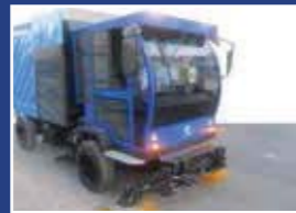
Yol Süpürme ve Araç Üzeri Uygulamaları