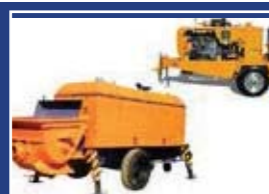
Beton Pompaları ve Kompresörler