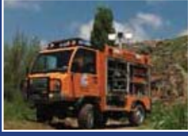
Hafif Ticari Araçlar